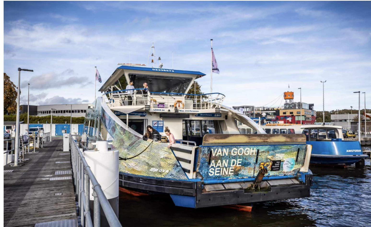
Tijdens het Ferry Festival is het NSDM-pontje een drijvend museum.

Jan Pieter Ekker 10 november 2023, 14:58